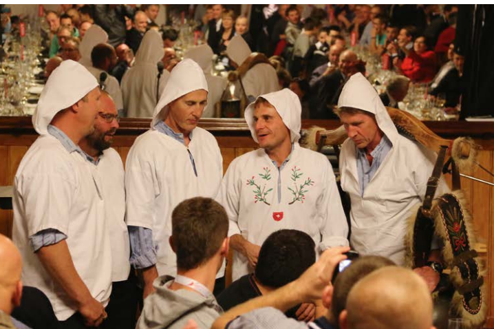
Urchige Feste & lebhaftes Brauchtum