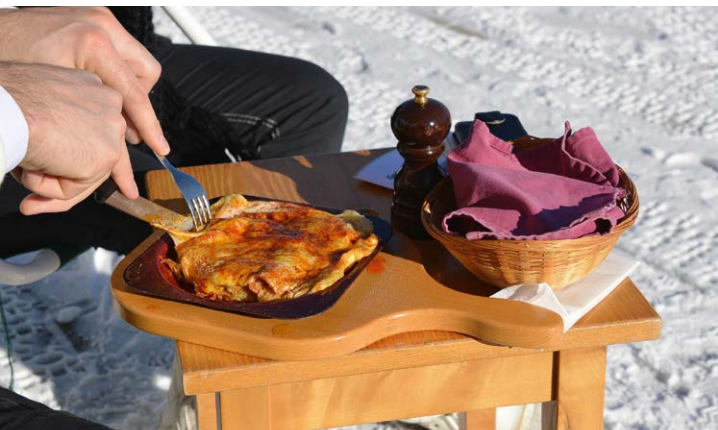
Regionale Produkte & Spezialitäten